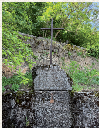
Lugar de descanso de San Juan de la Cruz en las inmediaciones del Jardín de los Poetas”