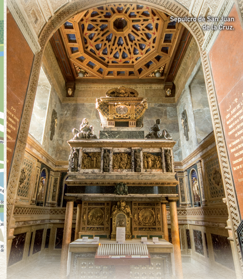
Sepulcro de San Juan de la Cruz.

Final de la ruta y lugar fundamental en la vida de San Juan de la Cruz. Aquí vivió sus últimos años, ejerció su cátedra al aire libre y reposan sus restos . La serenidad del convento y del valle contribuyó a inspirar algunos de los textos más importantes de la mística universal.