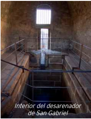
Interior del desarenador de San Gabriel

Declaración de Patrimonio de la Humanidad: 6 de diciembre de 1.985