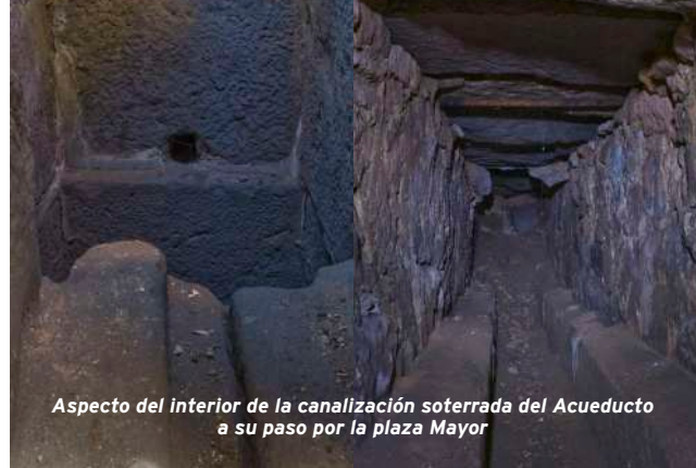
Aspecto del interior de la canalización soterrada del Acueducto a su paso por la plaza Mayor

El trazado soterrado señalizado responde al resultado de distintos controles arqueológicos preventivos vinculados a la renovación de distintas infraestructuras, desde el año 2002 hasta la actualidad.