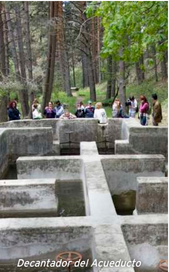
Decantador del Acueducto

La toma de agua que se observa en la actualidad se cita en las fuentes escritas en el s. XV y se realiza mediante un azud en el Río Frío. Después de recorrer distintos paisajes naturales de