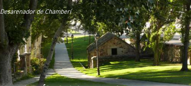
Desarenador de Chamberí

Longitud total del conducto de transporte desde su azud en la sierra de Guadarrama hasta la puerta del Alcázar: 16.186 m (sin contar la presa de captación, de 28 m de longitud)