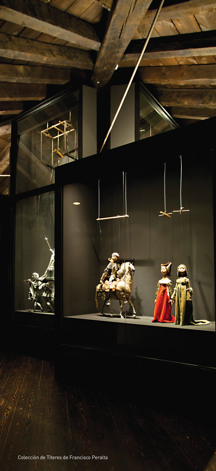
Colección de Títeres de Francisco Peralta