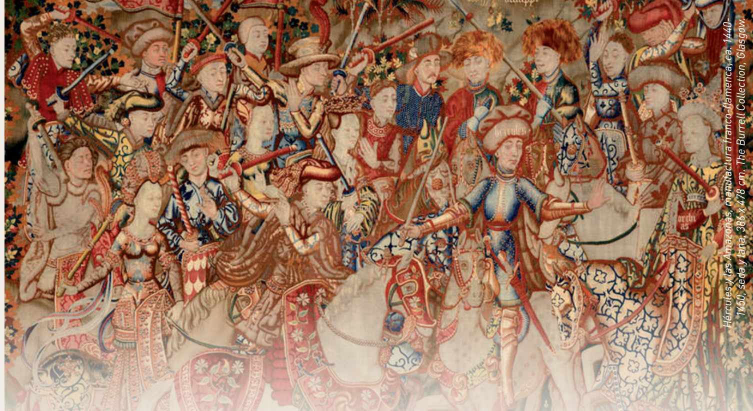
Hércules y las Amazonas, manufactura franco-flamenca, ca. 1440-1450, seda y lana. 386 x 478 cm. The Burrell Collection, Glasgow.