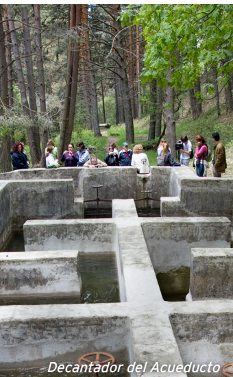
Decantador del Acueducto

La toma de agua que se observa en la actualidad se cita en las fuentes escritas en el s. XV y se realiza mediante un azud en el Río Frío. Después de recorrer distintos paisajes naturales de