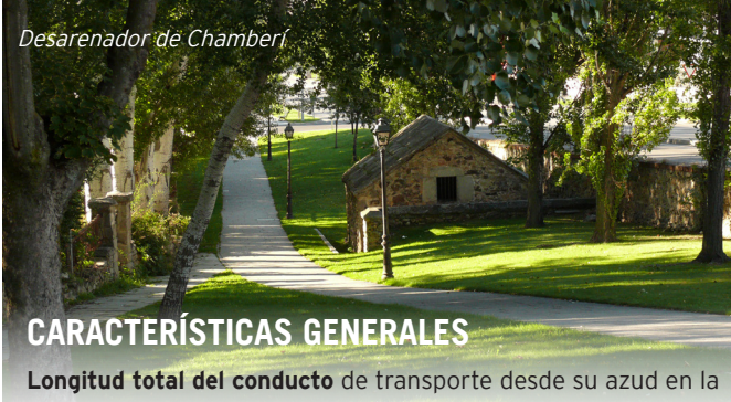
Desarenador de Chamberí

valor excepcional, llega mediante desnivel a Segovia. Antes de elevarse sobre los arcos, el agua pasaba por dos decantadores en la conducción desde la Edad Media. El recorrido intramuros, que sólo se documentaba desde la Edad Media, comienza en el Postigo del Consuelo, desarrollando un sofisticado sistema de distribución mediante arquetas, que a su vez, se subdividían en derivaciones de menor entidad que abastecían fuentes y aljibes de casas particulares. Todo este último tramo iba subterráneo hasta llegar al actual Alcázar, punto final del recorrido, y era conocido como la “Madre del Agua”.