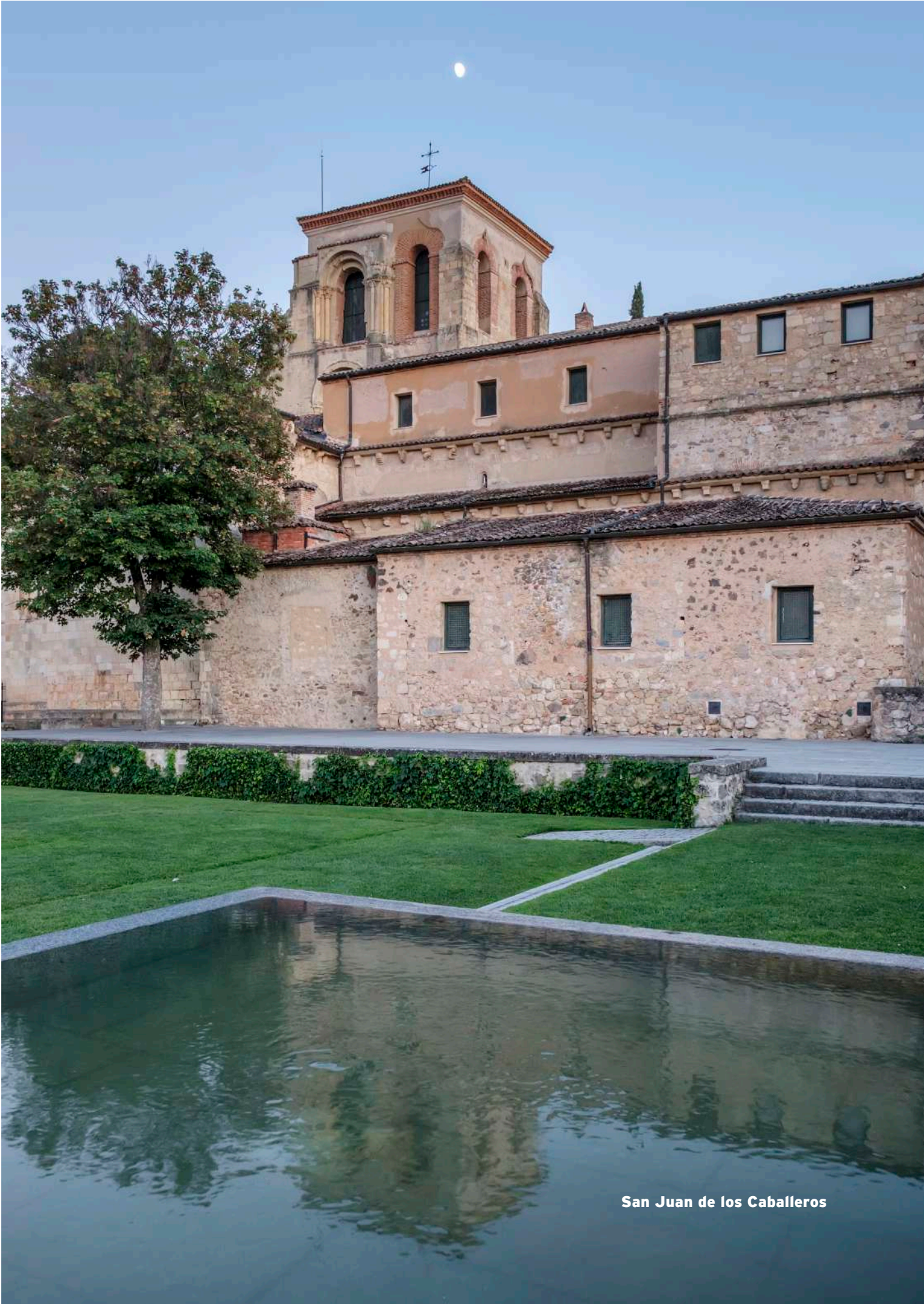
San Juan de los Caballeros