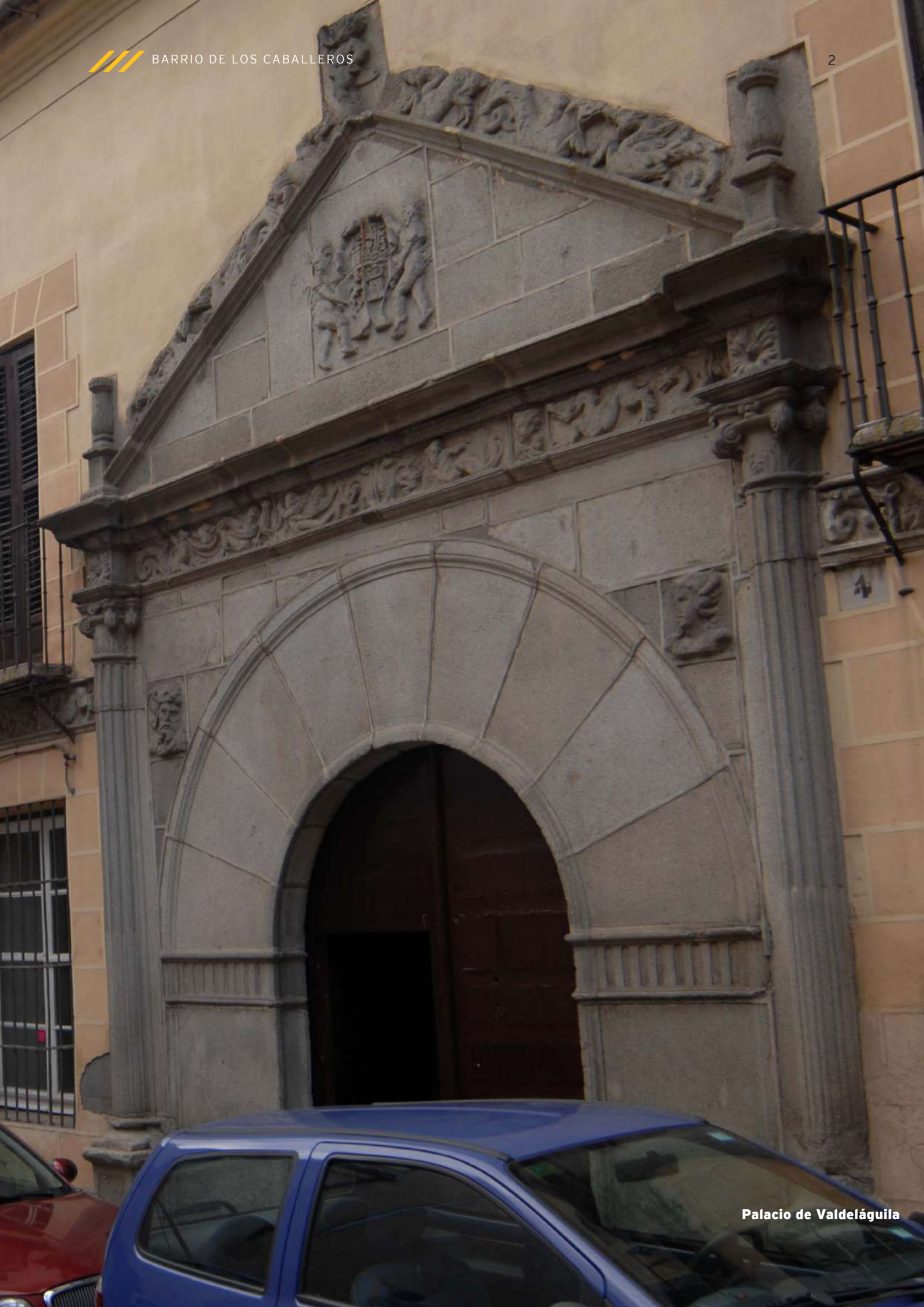
Palacio de Valdeláguila