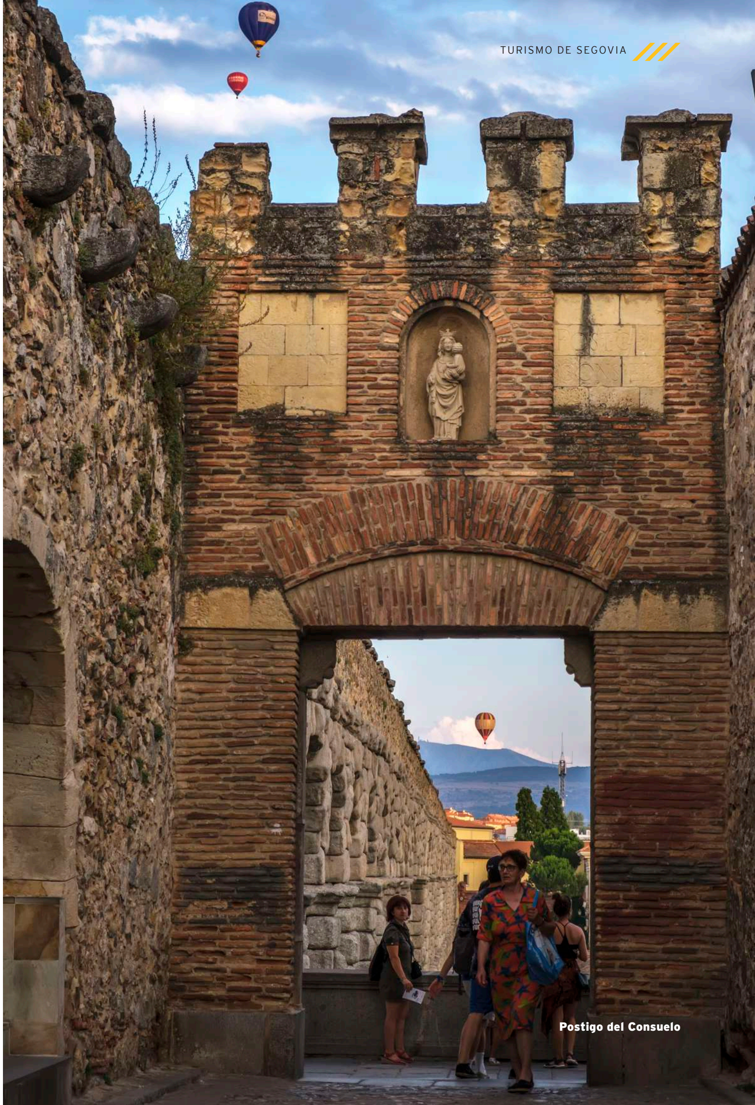
Postigo del Consuelo