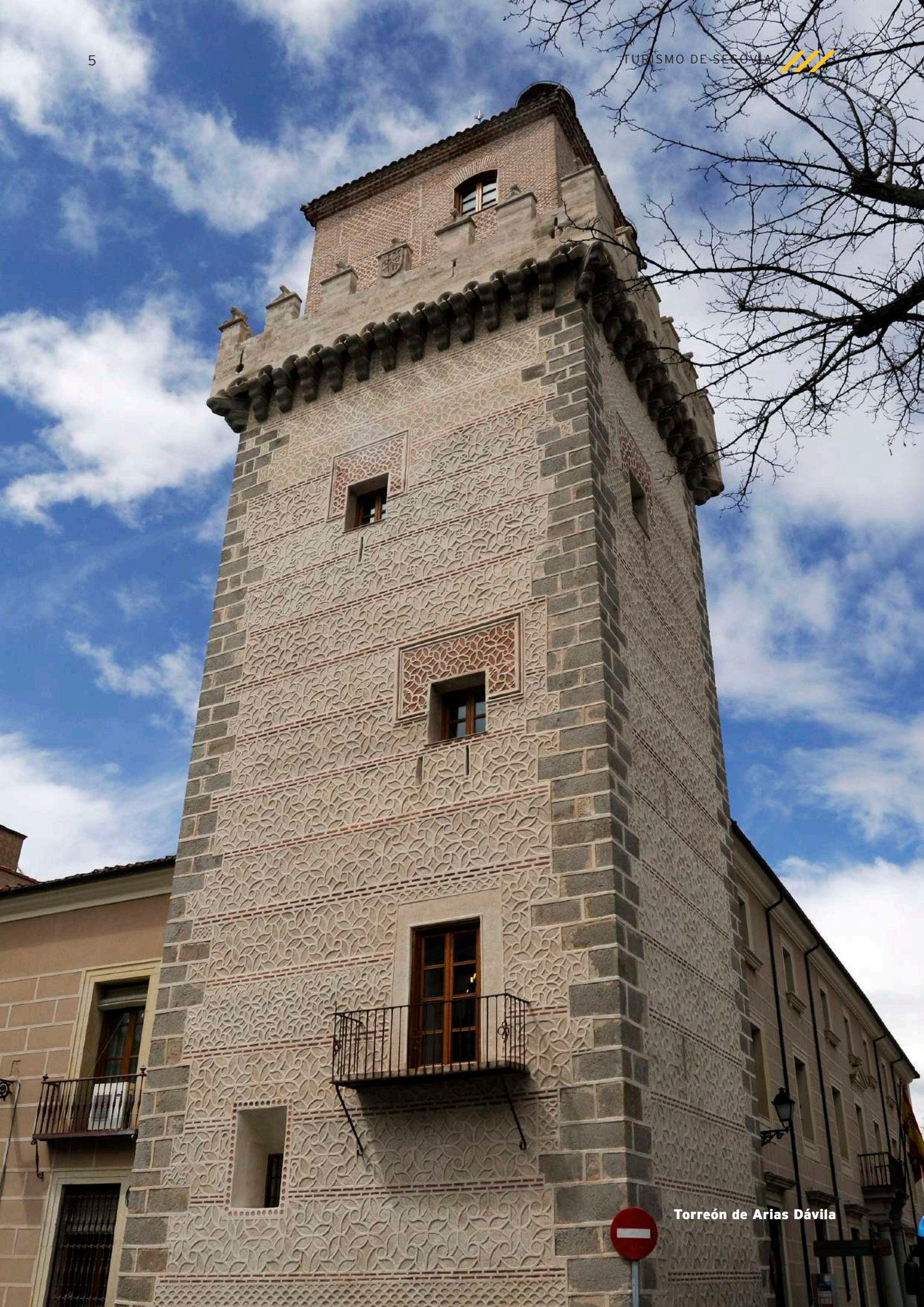
Torreón de Arias Dávila