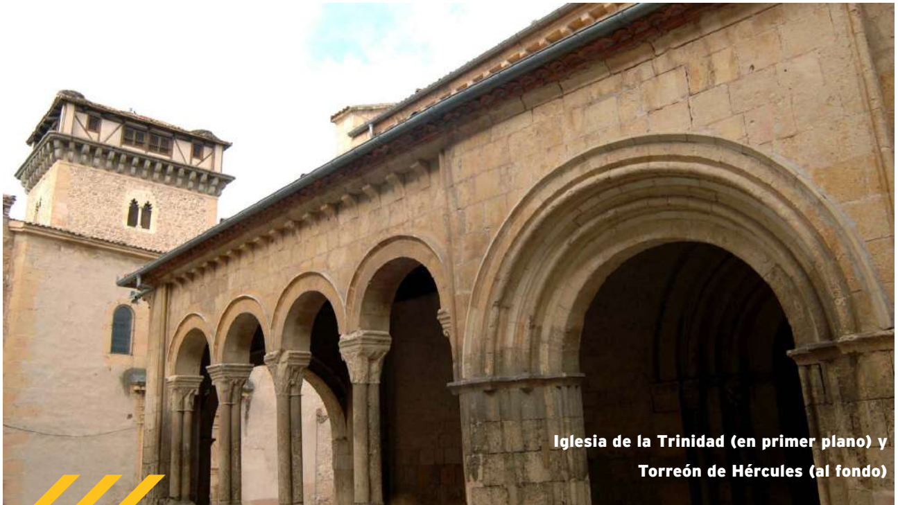
Iglesia de la Trinidad (en primer plano) y Torreón de Hércules (al fondo)

Recorre las calles de la vertiente norte del recinto amurallado , podrás conocer los palacios donde vivieron las familias de noble linaje desde el siglo XI. En esta zona también podrás encontrar algunos de los museos con encanto de Segovia.