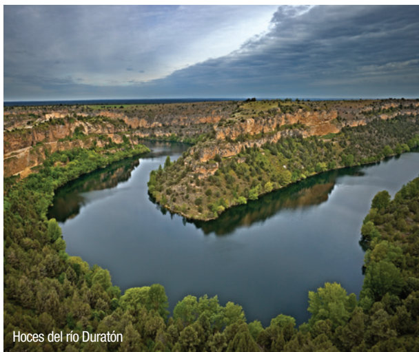
Hoces del río Duratón