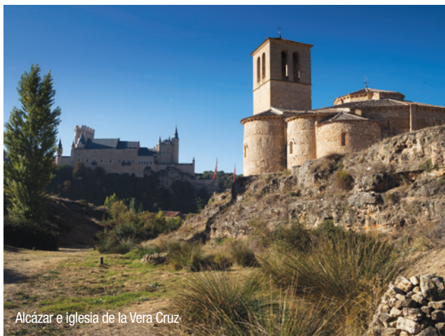
Alcázar e iglesia de la Vera Cruz

Segovia está declarada desde 1985 Ciudad Patrimonio de la Humanidad. Durante el recorrido podemos admirar distintos monumentos: Acueducto, Casa de los Picos, Plaza Medina del Campo y monumento a Juan Bravo, iglesia románica de San Martín, antigua Sinagoga Mayor (actual iglesia del Corpus Christi), barrios de la Judería y Canonjías. Para llegar a la Catedral, caminaremos por calles estrechas y plazuelas bajo la mirada atenta de San Juan de la Cruz, cuya estatua encontraremos próxima a la Casa - Museo de Antonio Machado. Saldremos del recinto amurallado por la Puerta de Santiago, que acoge la Colección de Títeres de Francisco Peralta, y desembocaremos en los jardines del Alcázar y el puente de San Marcos que nos conducirán hasta la iglesia de la Vera Cruz.