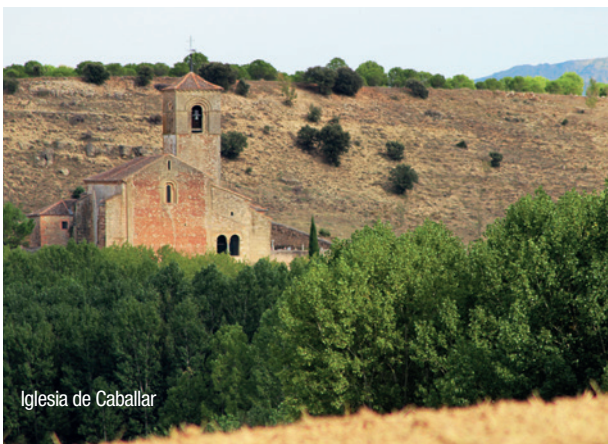
Iglesia de Caballar