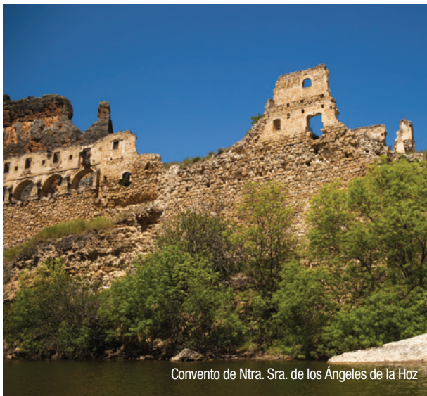
Convento de Ntra. Sra. de los Ángeles de la Hoz