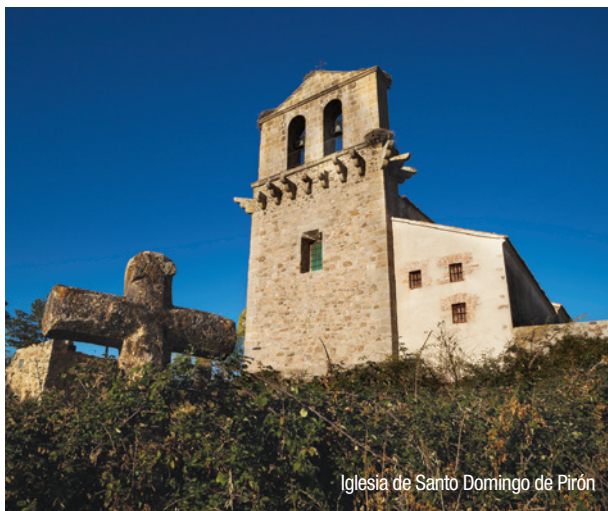
Iglesia de Santo Domingo de Pirón